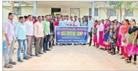
కొండుగారిపల్లెకు బయలుదేరుతున్న విద్యార్థులు