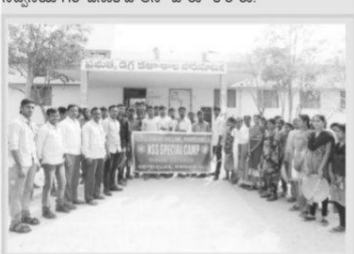
క్యాంప్ కు బయలుదేరుతున్న ఎన్ఎస్ఎస్ విద్యార్థులు