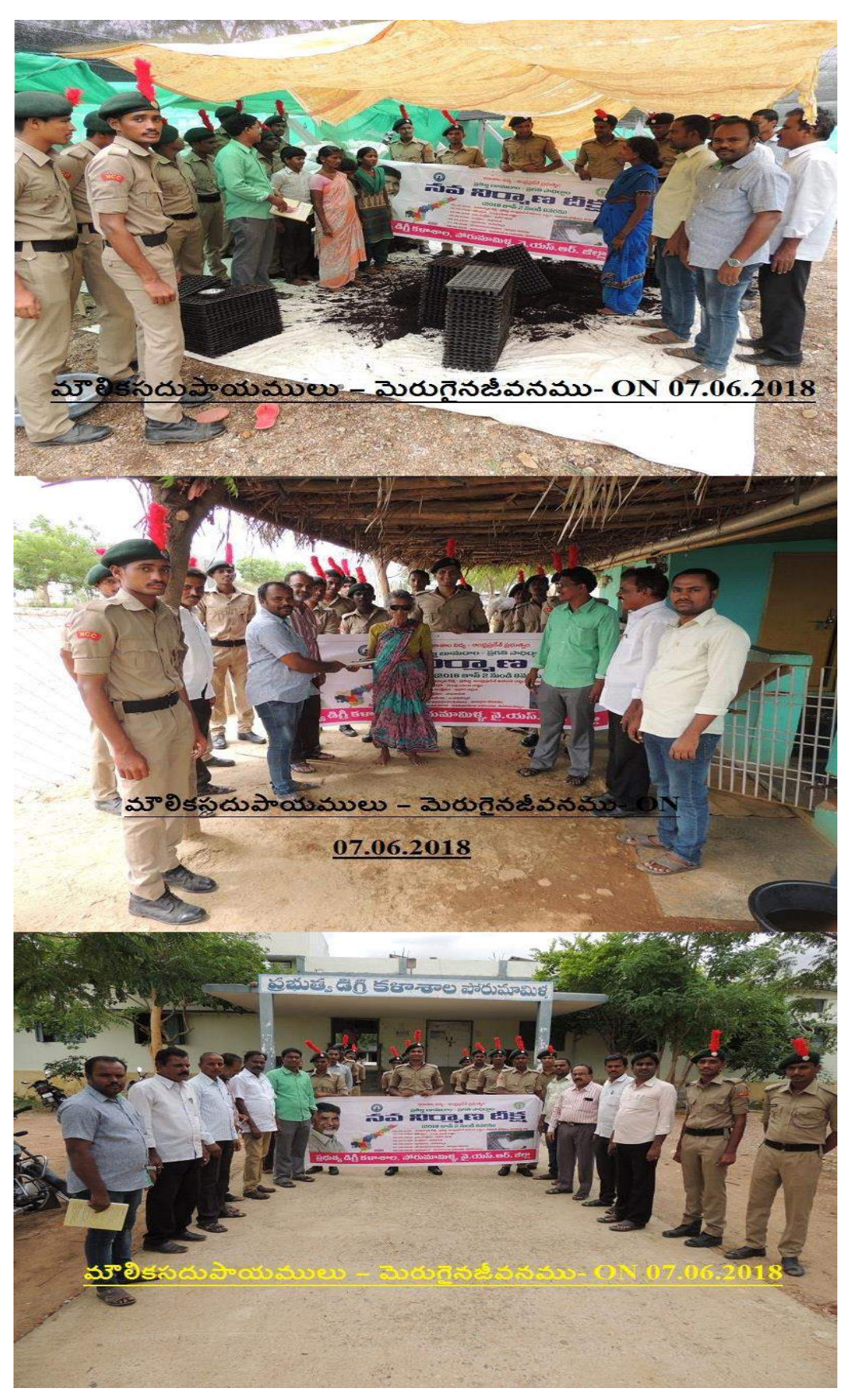
Page 12 of